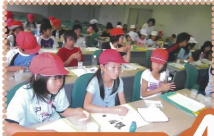
環境学習情報センターで水質検査