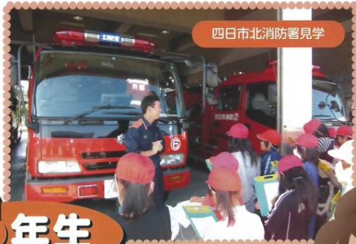
四日市北消防署見学