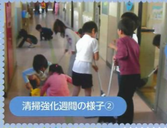
清掃強化週間の様子②