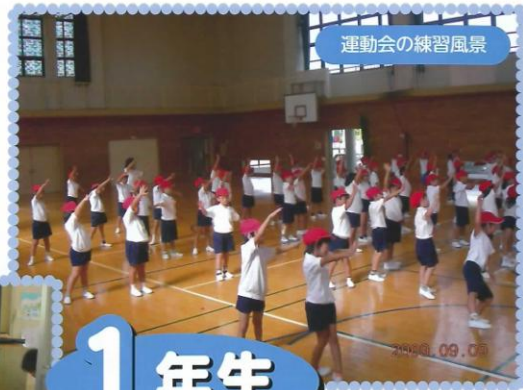
運動会の練習風景