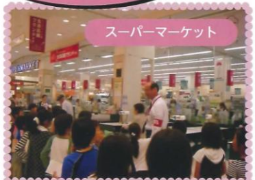
スーパーマーケット