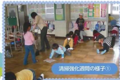
清掃強化週間の様子①