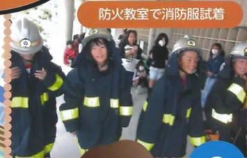
防火教室で消防服試着